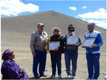
“Цэцээ гүн-2017” явган аялалыг спортын секц дугуйлангийн сурагчдын дунд зохион явуулж 42 хүнийг хамруулсан.