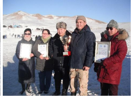
Аймгийн засаг даргын 2017 оны 04-р сарын 07-ны өдрийн а/217 тоот захирамжаар долоо хоног бүрийн 3 дахь өдрийг НЭМ-ийн өдөр болгон “Нарны алхаа”-г Зуунмод суманд 10 удаа зохион явуулж 3753, сумдад 9 удаа зохион явуулж 3741 хүнийг хамруулсан.