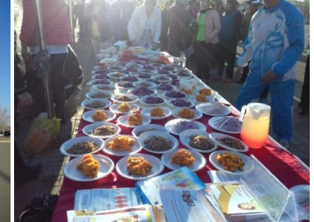
“Ланс-2017” явган аялалыг Зуунмод сумын ахмадуудын дунд Дашчойнхорлон хийдтэй хамтран зохион явуулж Зуунмод сумын 4 багийн 40 гаруй ахмадууд оролцсон.