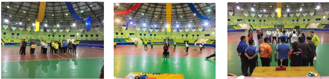
“Хөдөлгөөн эрүүл мэнд -2018” өдөрлөгийг Заамар суманд Аймгийн Ахмадын хороотой хамтран зохион явуулж 9-н сумын 10-н багийн 230 тамирчин спортын 4-н төрлөөр