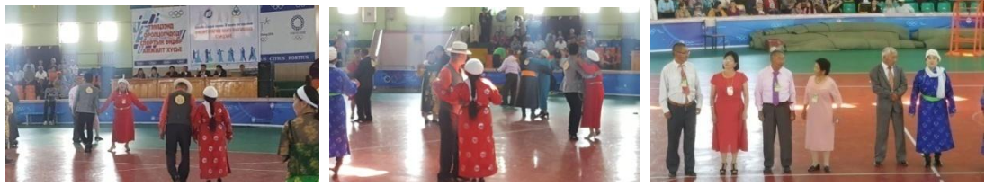
Сүмбэр суманд Хөдөлгөөн эрүүл мэнд өдөрлөгийг 5-н сумын 5-н багийн дунд 4-н төрлийн тэмцээнд 122 хүн оролцсон.