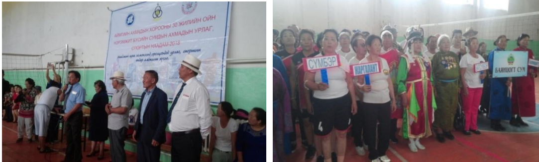
Аймгийн ИТХ-ын тэргүүлэгчдийн уламжлалт тэмцээнийг зохион байгуулж 6 багийн 34 тамирчин